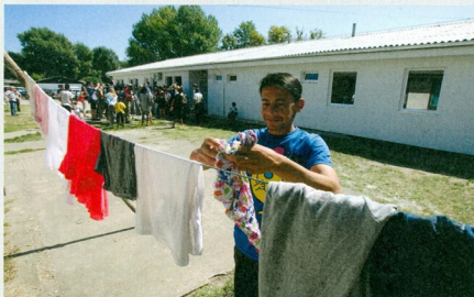
IZBeglički KAMP U KRnjači: Privremeno ili stalno boravište